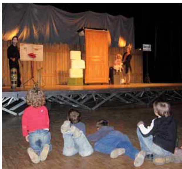
Spectacle « Papy recyclé et Cie ».