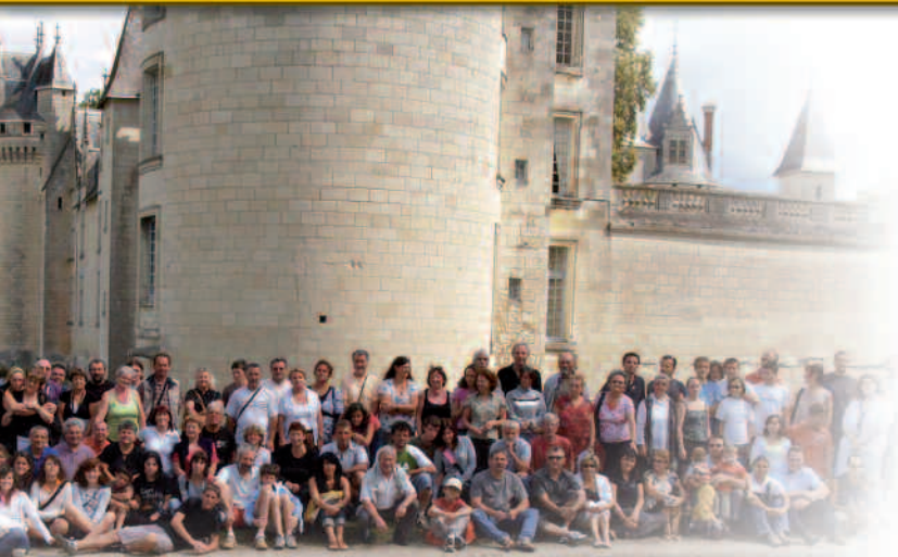
Rassemblement jumelage Dissay, Madone, Barquina, août 2008