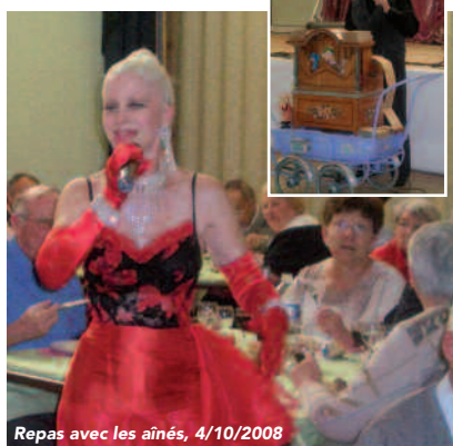
Repas avec les aînés, 4/10/2008

Tous les ans avant les fêtes, le CCAS invite les disséens de plus de 65 ans à un repas-spectacle. C'est une journée très conviviale animée par des artistes. Et pour les personnes de 70 ans et plus qui n'ont pas pu se déplacer pour des raisons de santé, un panier garni leur est offert et porté.