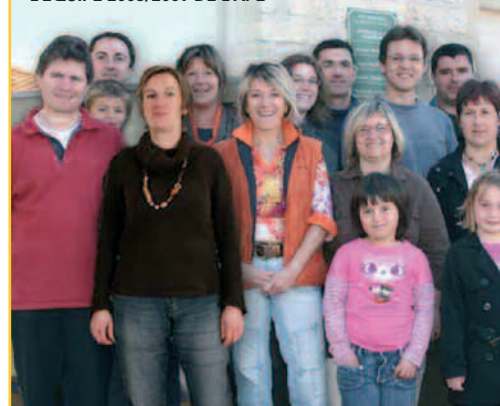
L'ÉQUIPE 2008/2009 DE L'APE

L'APE c'est aussi la mobilisation de parents, soutenus par de nombreux Disséens, contre les fermetures de classe. Depuis 10 ans déjà, l'APE s'investit pour les enfants de Dissay et met en évidence la place majeure de l'école dans la commune!