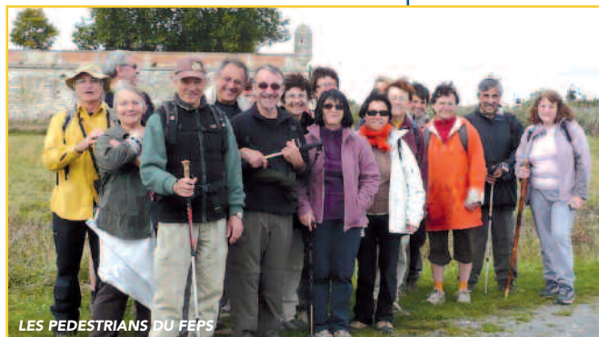
LES PEDESTRIANS DU FEPS

Sous le sigle FEPS se cache l'une des plus anciennes associations de la commune, surnommée "le Foyer". Il compte 6 sections :