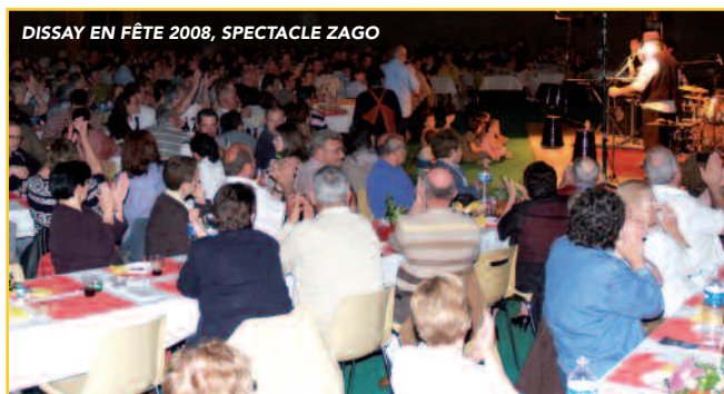
DISSAY EN FÊTE 2008, SPECTACLE ZAGO

Le club Cynophile de Dissay, c'est aussi une équipe de compétiteurs qui s'illustre en Poitou-Charentes dans plusieurs