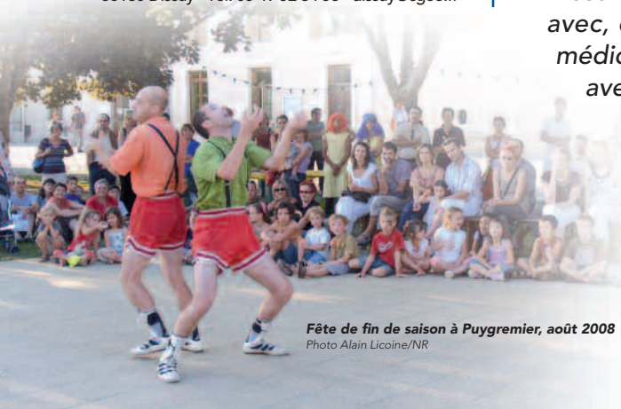
Fête de fin de saison à Puygremier, août 2008