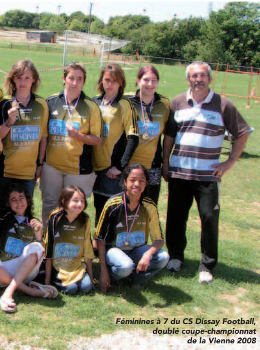
Féminines à 7 du CS Dissay Football, doublé coupe-championnat de la Vienne 2008

planning de réservation est établi en juin pour l'année suivante avec les associations disséennes, utilisatrices privilégiées de ces salles. La réservation est ensuite ouverte aux particuliers. Devant le succès de ces locations, il a paru opportun de mettre