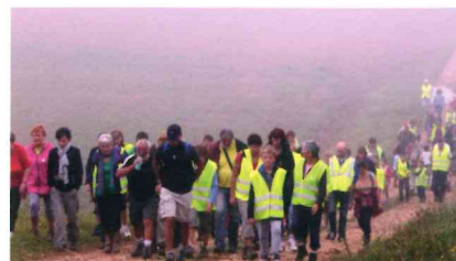
De nombreux disséennes et disséens se mobilisent pour l'environnement, comme à l'occasion de La Marche pour le climat en septembre 2014.

Votre engagement est important pour l'avenir de la commune, pour votre avenir et celui des générations futures. Nous vous remercions par avance de votre précieuse participation.