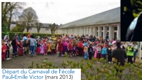
Départ du Carnaval de l'école Paul-Emile Victor (mars 2013)