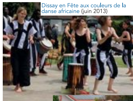
Dissay en Fête aux couleurs de la danse africaine (juin 2013)