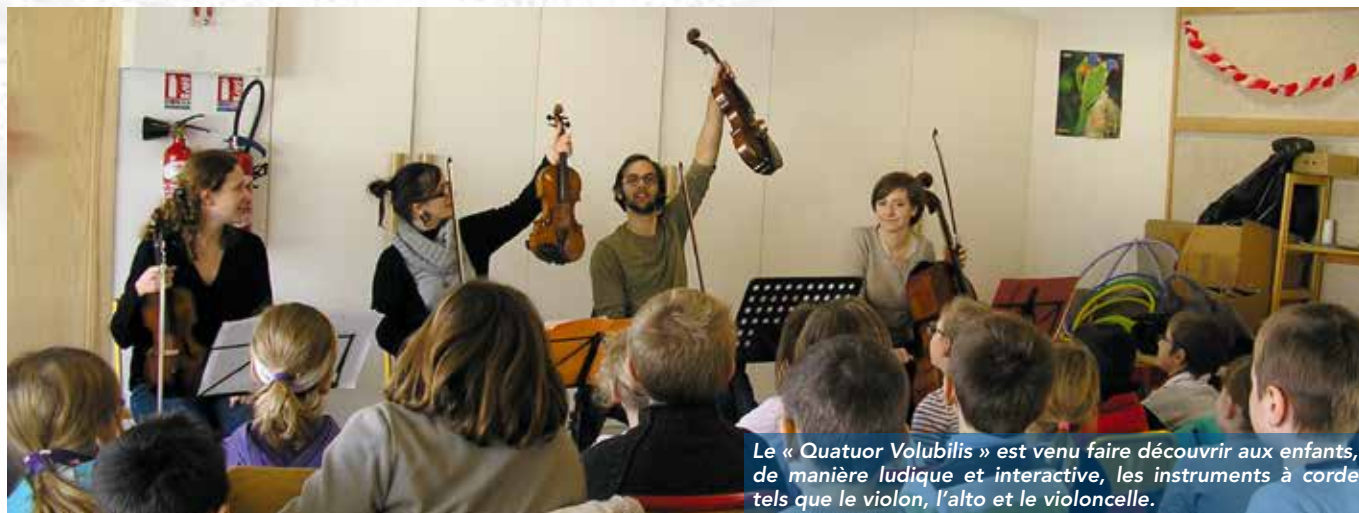
Le « Quatuor Volubilis » est venu faire découvrir aux enfants, de manière ludique et interactive, les instruments à corde tels que le violon, l'alto et le violoncelle.

La concertation et la participation des acteurs locaux ont permis à la municipalité d'appliquer la réforme des rythmes scolaires (passage de l'école à 4,5 jours) dès septembre 2013.