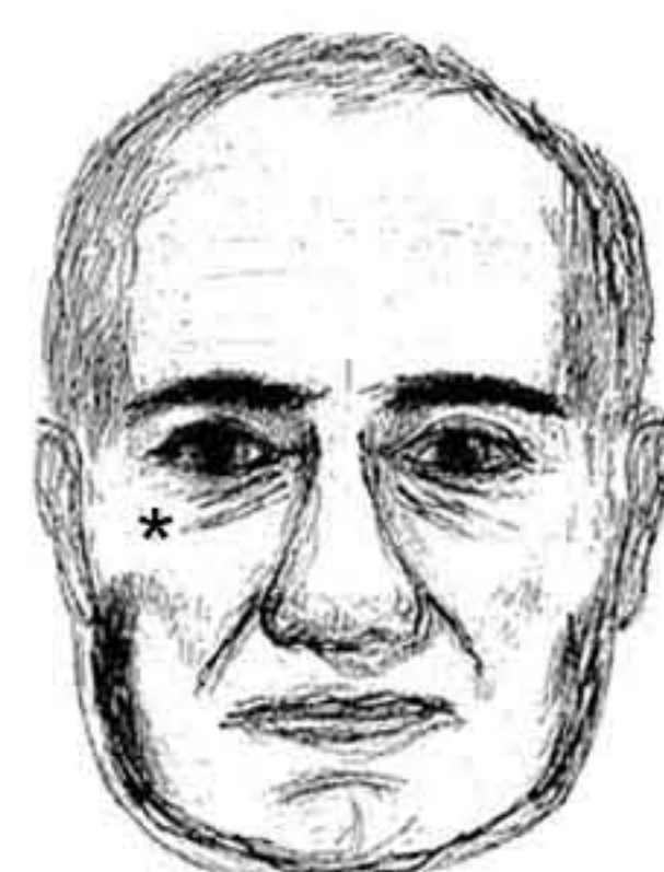
Portrait robot de l'X de Dissay