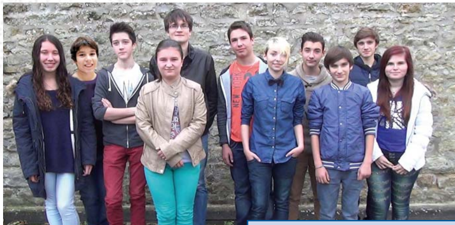
Le CCJ pour la période 2014-2017